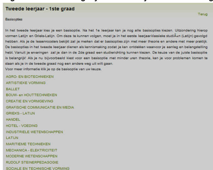
Figuur 3: Toelichting bij het 2 de leerjaar van de 1 ste graad

Binnen het stelsel Leren en werken bestaat het deeltijds BSO en de leertijd. Voor het DBSO geeft men een overzicht van de lineaire opleidingen per rubriek of de modulaire opleidingen per studiegebied. Er zijn geen afzonderlijke steekkaarten per studierichting. Bij de modulaire opleidingen kan men de structuurschema's raadplegen. Voor de leertijd zijn er geen steekkaarten per opleiding. Men verwijst naar de website www.leertijd.be .